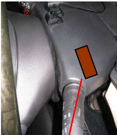
コラムカバーを外した状態